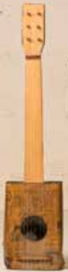
— No Name, Südafrika —