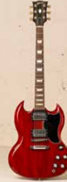
— Gibson SG (2012) —