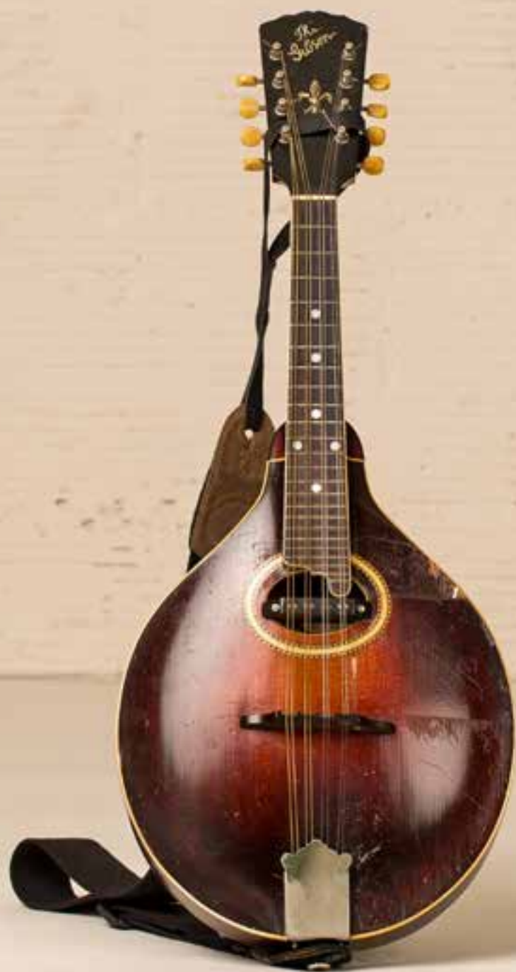
— Gibson Mandoline A 4 (1921) —