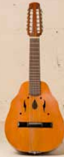
— Lauda Esteve (1992) —