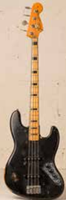
— Fender Jazz Bass (1974) —

— «Alpenmusik ist eng und weit, knorzig und luftig, ganz wie die Landschaft, in der sie entsteht» —