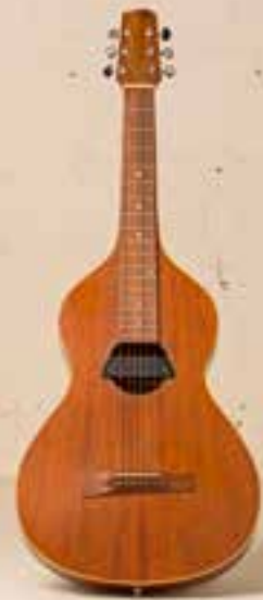
— Manzanita Weissenborn, Mahagoni (2006) —