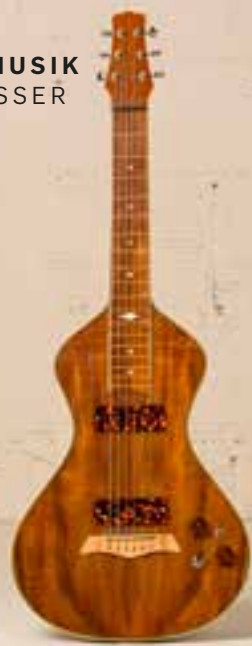
— Bill Asher Lap Steel (ca. 2003) —