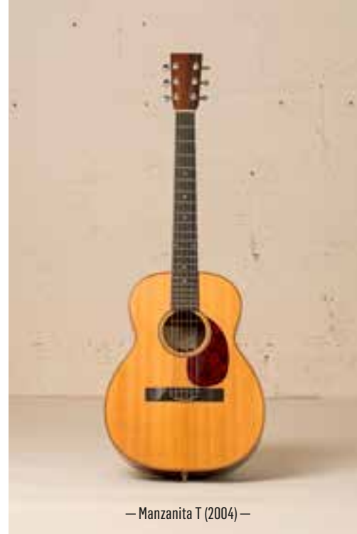
— Manzanita T (2004) —