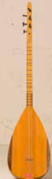
— Saz —