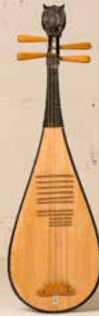
— Pipa —

— «Von jeder Reise habe ich eine Gitarre mit nach Hause gebracht» —