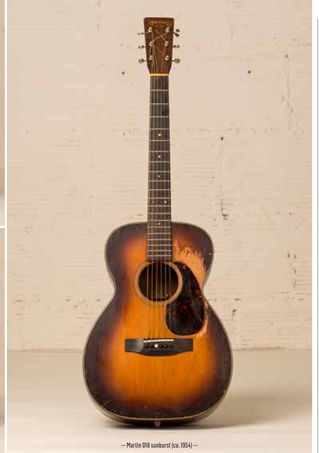
— Martin 018 sunburst (ca. 1954) —