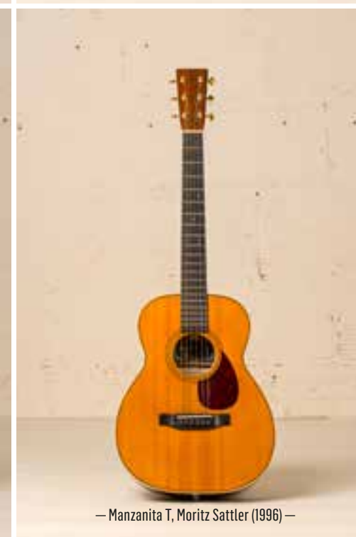
— Manzanita T, Moritz Sattler (1996) —