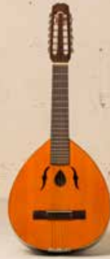
— Lauda Alhambra (1981) —