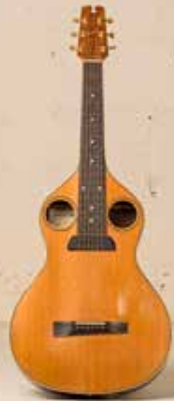
— Manzanita H (1998) —