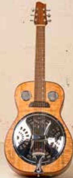
— Manzanita Reso Dobro (2011) —