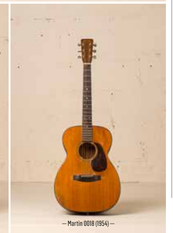
— Martin 0018 (1954) —