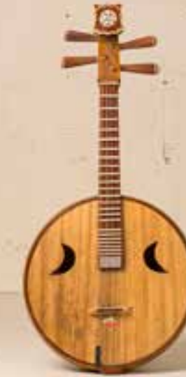
— Mondlaute —