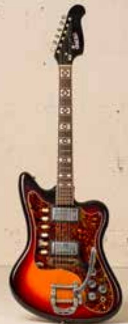
— Supro Lexington (1968) —