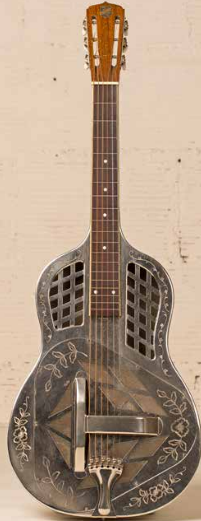
— National Tricone (ca. 1935) —