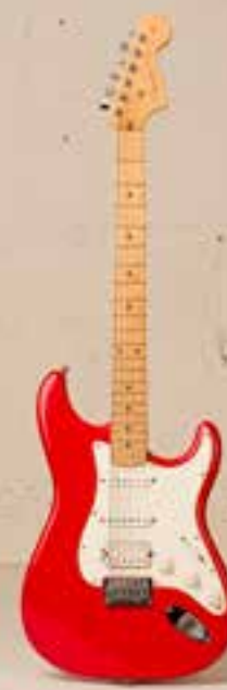
— Fender Sub Sonic Bariton (2004) —