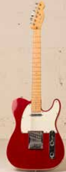
— Fender Tele (2002) —