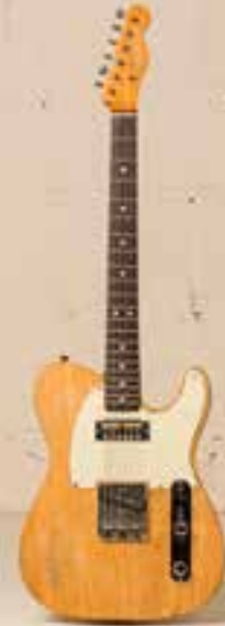
— Fender Telecaster (1966) —