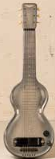
— Rickenbacher Lap Steel (ca. 1930) —