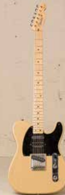
— Fender Bajo Sexto (ca. 1998) —