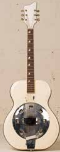
— Supro Folk Star Dobro (1953) —