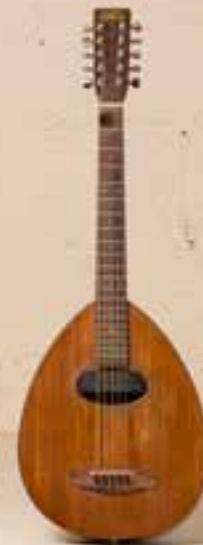
— Bouzuki Fylde —