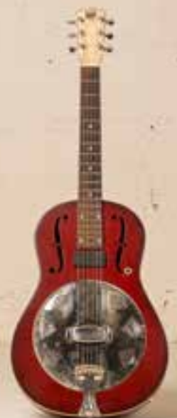
— National Reso-Phonic M 1 (1991) —