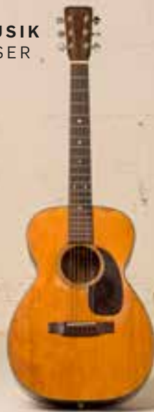
— Martin 018 (1958) —