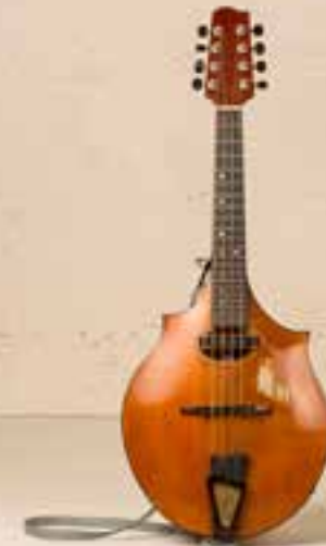
— Manzanita Mandola (2012) —