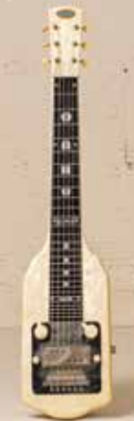
— Dahu Lap Steel (1954) —