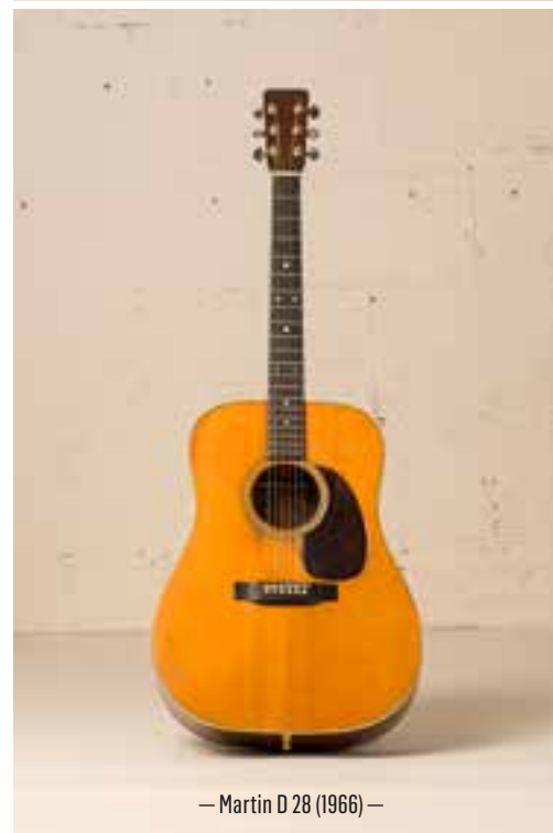
— Martin D 28 (1966) —