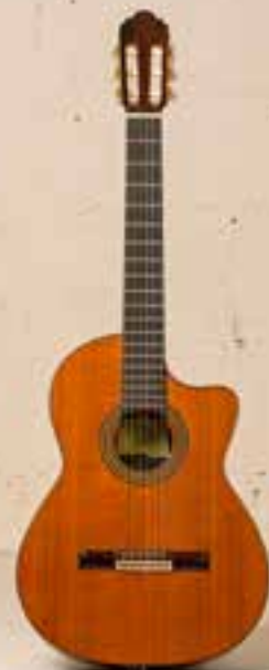
— Antonio Picado Classical (ca. 1990) —