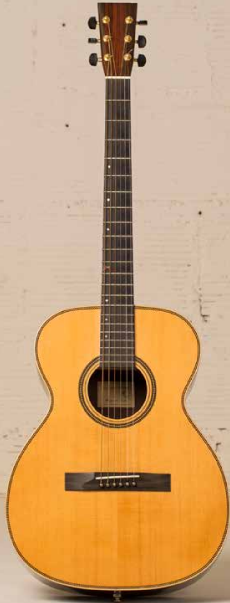
— Manzanita OM Bariton, Long Neck (2005) —