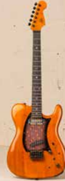
— Paradeis Tele (1994) —