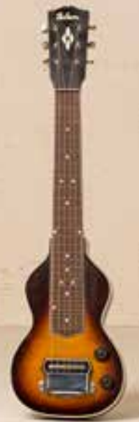
— Gibson Lap Steel (1936) —