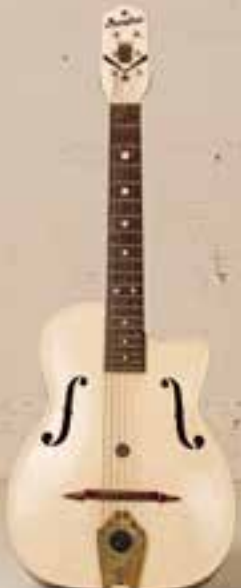
— Maccaferri G40 (ca. 1953) —