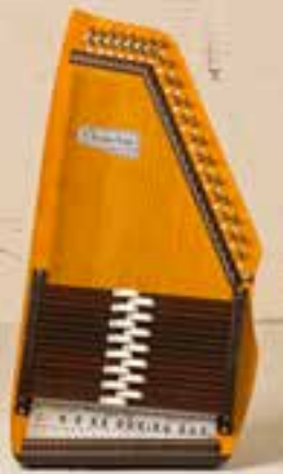
— Autoharp —