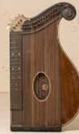
— Zither —