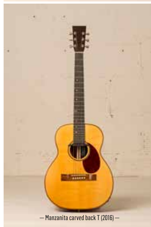
— Manzanita carved back T (2016) —