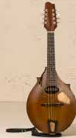
— Manzanita Mandolin (2010) —