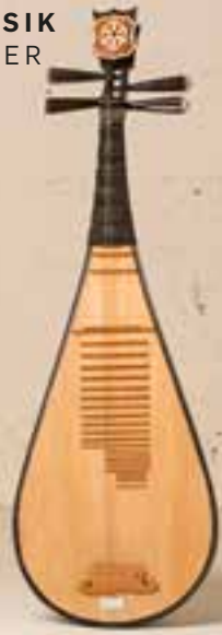
— Pipa —