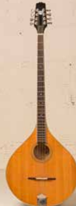
— Bouzuki Trinity College —