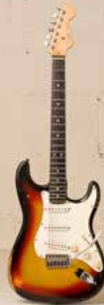
— Fender Stratocaster (1966) —